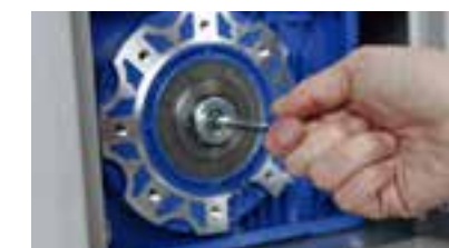
Practico sistema de desbloqueo con llave personalizada